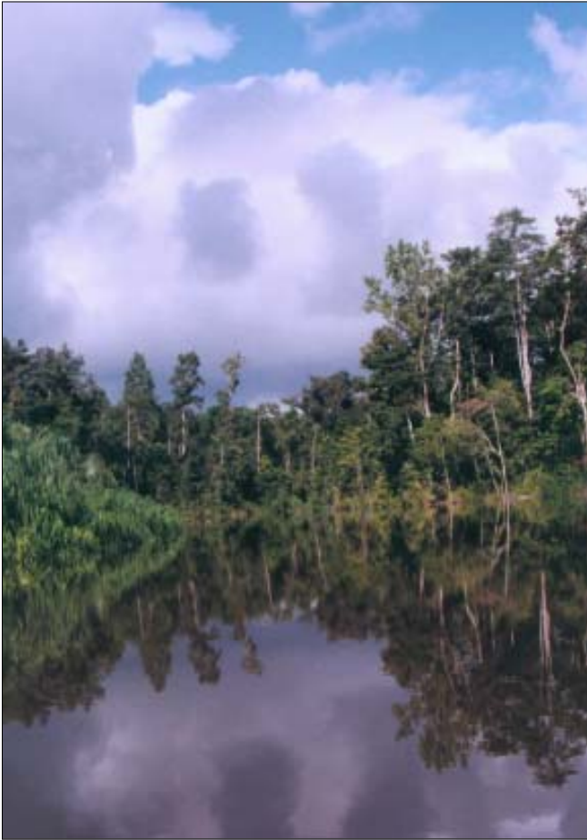
doc. FWI Simpul Papua

kelompok-kelompok masyarakat sipil berada di garis depan untuk menekan keterbukaan informasi resmi dan mempublikasikan hasilnya. Dengan terbukanya informasi ini, sejauh mana sumber-sumber daya alam Indonesia – terutama hutan – telah disalahgunakan dan diboroskan kemudian menjadi jelas. Sekarang kisah ini akan mulai diceritakan.