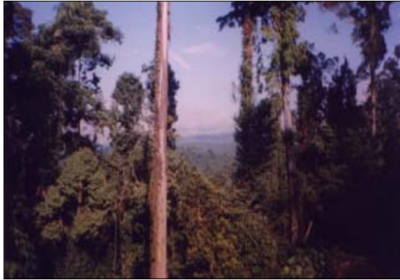
doc. FWI Simpul Sulawesi