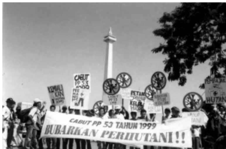
Demo Petani menuntut pengembalian tanah di Jakarta